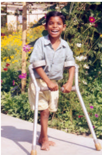
Hussein (IMC) foyer de BAKUABARI

Des amis nous ont fait part à plusieurs reprises de leur souhait de parrainer un enfant ou un groupe d'enfants. Désormais, HOWRAH SOUTH POINT (HSP) nous propose de parrainer un enfant ou de parrainer une personne âgée ou infirme. Ces deux nouveaux projets formulés par HSP répondent à un besoin réel, recensé et mis au point par l'équipe indienne. Nous vous tiendrons informés du déroulement de ces projets et de l'aide apportée aux enfants et personnes âgées à partir de la prochaine « Lettre aux Amis ». Pour débiter, les parrainages ne seront pas personnalisés (avec nom du filleul et correspondance personnelle avec lui) mais ils couvriront cependant le groupe sélectionné : enfant ou personne âgée.