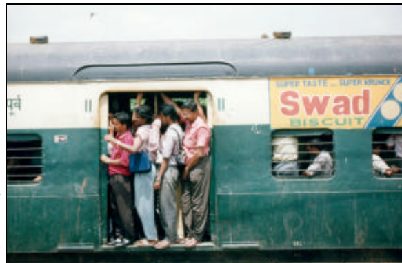
Train bondé (banlieue de Calcutta)

Activités pastorales - « Mes activités pastorales sont variées : les séminaristes bien sûr à Morning Star College ; la petite paroisse d'adivasis à Kowgachi (à 7 km de M.S.C.) qui me donnent bien des satisfactions et pour laquelle je fais faire en ce moment les travaux ; les visites aux centres de Howrah South Point à Jalpaiguri et surtout Howrah; et enfin les nombreuses personnes qui viennent me visiter qui sont souvent d'anciens paroissiens des différentes paroisses où j'étais. » (extrait de la lettre du 21/08/00)