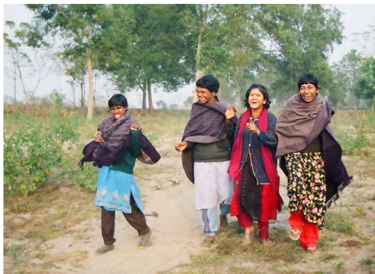
Quatre des filles qui vont travailler dans le nouveau centre

Nous avons donc découvert HSP et avons pu constater son efficacité et ses bienfaits. Il règne dans chacun des centres une grande joie de vivre, malgré les nombreux handicaps. Nous voulons remercier les didis et dadas qui nous ont accueillis si chaleureusement, les enfants et les adultes avec lesquels nous avons bien ri ! Et APC de nous avoir mis en contact avec eux !