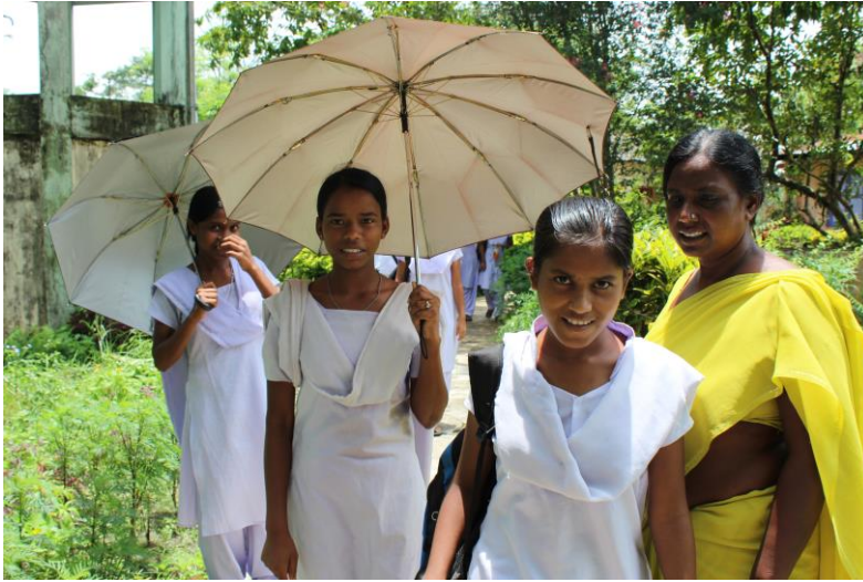
Départ pour l'école au foyer Ananda Dhara, Bakuabari.