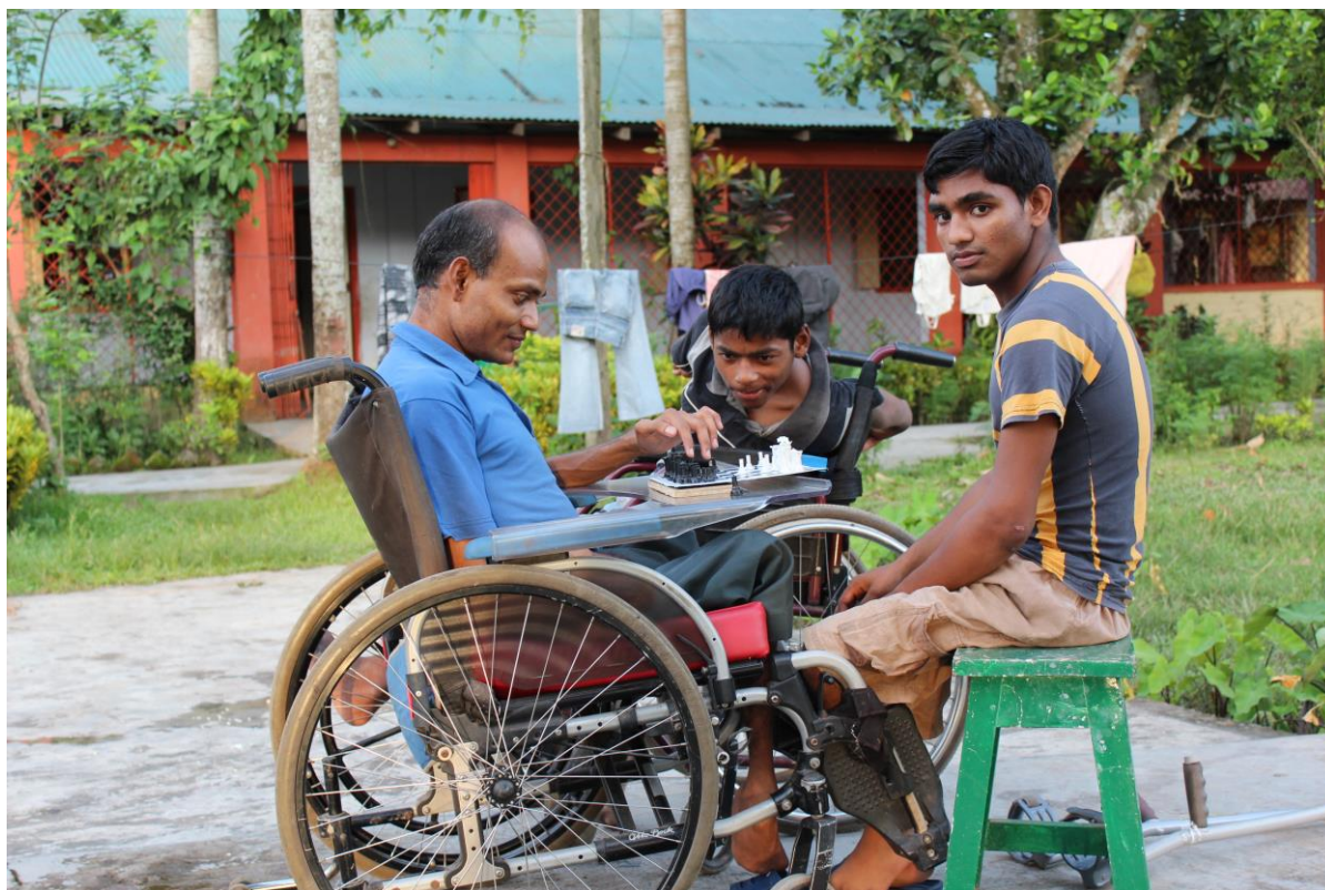
Autour d'un jeu d'échec dans le jardin du foyer de Jordighi