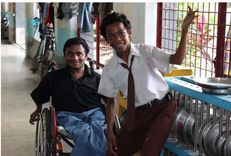
Sous la véranda du bâtiment des garçons au Foyer d'Asha Neer