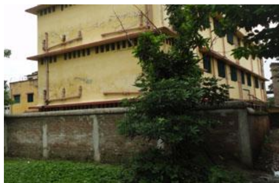
Photo du mur terminé

travaux du mur ont été terminés en novembre 2012.