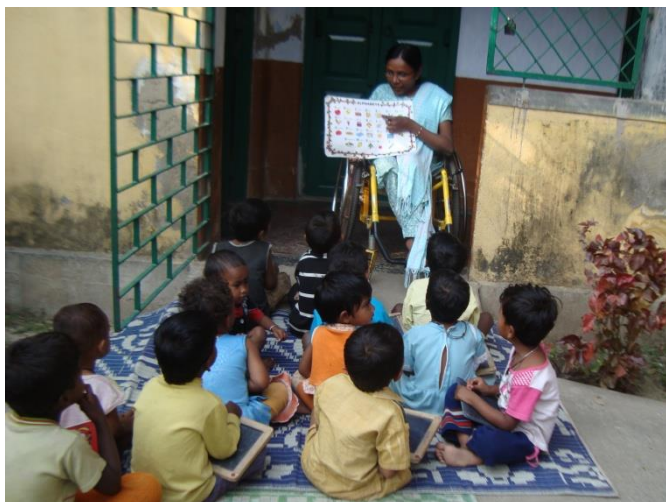
Apprentissage de l'alphabet à EPN

Travailleurs journaliers, sans aucune protection sociale, ils ne peuvent se permettre de ne pas travailler. Les nourrissons arrivent souvent dans un état de très grande faiblesse et la crèche est essentielle pour leur alimentation correcte.