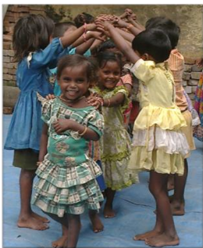
Séance de jeux à Bisco brick fields

Les crèches d'HSP accueillent les enfants de 9h à 17h. La journée commence par un petit déjeuner suivi d'une session de jeux. Elle se poursuit avec des temps d'étude, de danse, de chant et de siestes. Un repas équilibré est servi aux enfants le midi.