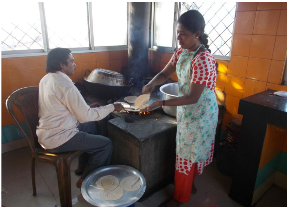
Préparation des chapatis(চাপাটি) pour le petit-déjeuner dans la nouvelle cuisine

Cela fait maintenant plusieurs Lettres aux Amis que nous vous faisons part de l'avancement du projet de foyer à Kalipathore. Après l'inauguration du foyer des filles en octobre 2013, les bâtiments de la cuisine et des sanitaires ont pu être construits :