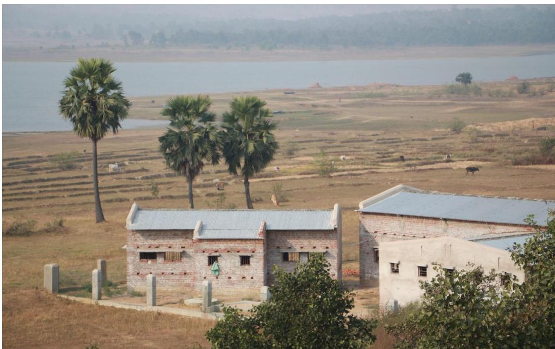
Vue du foyer de garçons et du bâtiment des sanitaires depuis le toit du foyer de filles

Voici les dernières nouvelles reçues en mars du père François Laborde : « Le foyer des garçons est terminé et a été inauguré. Il est entièrement en rez-de-chaussée, comprenant deux grands halls à emplois multiples, pouvant servir, à la mode indienne, de dortoir, de salle d'études ou de réunions pour jeux d'intérieur ou « fonctions » (NDLR : spectacles).