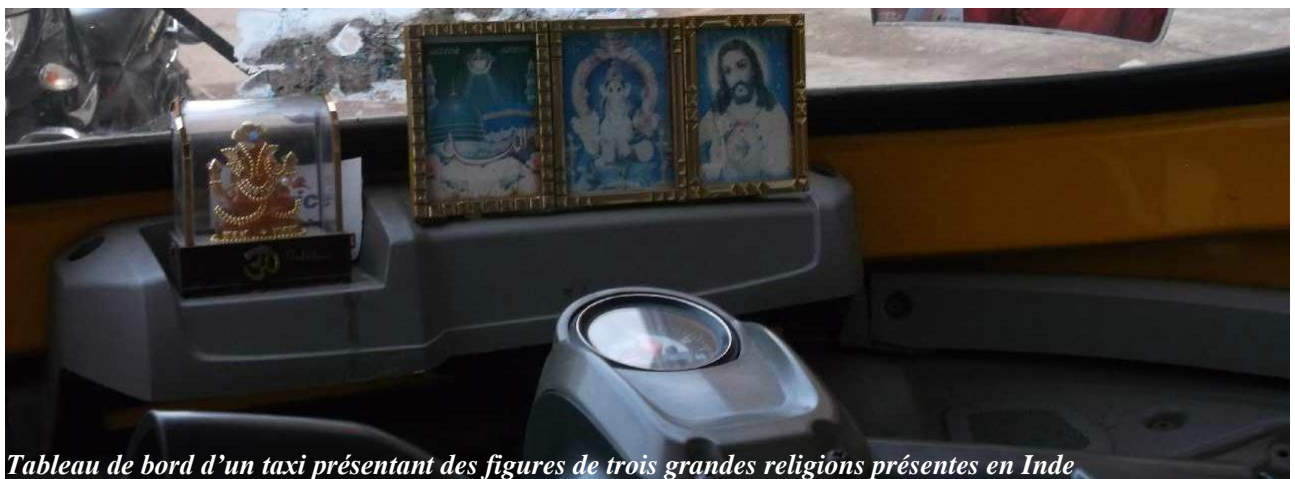
Tableau de bord d'un taxi présentant des figures de trois grandes religions présentes en Inde